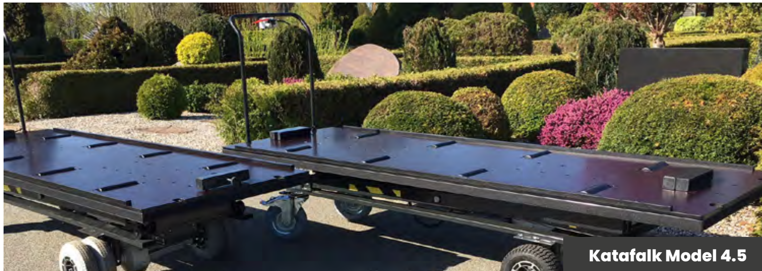
Katafalk Model 4.5