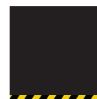
Jernplade med sikkerhedsbånd